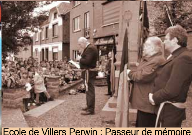
Ecole de Villers Perwin : Passer de mémoire