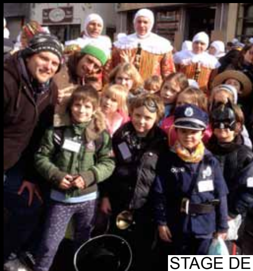
STAGE DE CARNAVAL