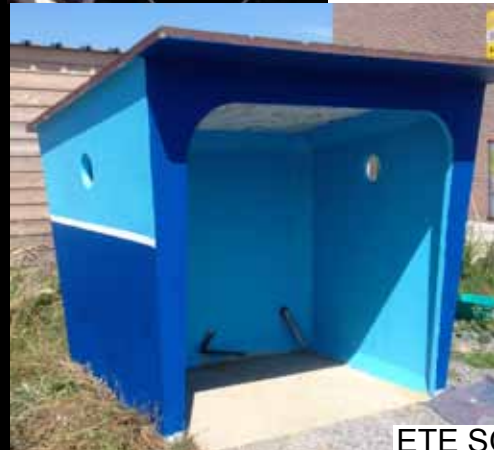
ETE SOLIDAIRE 2014