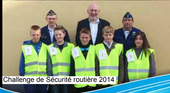
Challenge de Sécurité routière 2014