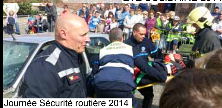
Journée Sécurité routière 2014